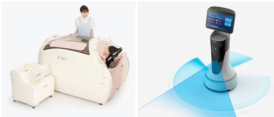
▲導入予定設備の一例①:ミスト浴槽(左)とChat GPTと連動した受付ロボット(右)。受付ロボットは、施設に訪問をした家族様の受付や食事時の利用者様の誘導などを行う予定。

なお、本施設の開設にあたり、CUCでは最新の介護機器の導入やオペレーション設計などの面で白楊会の支援を行い、省人化とケアの質の担保の両立を目指してまいります。